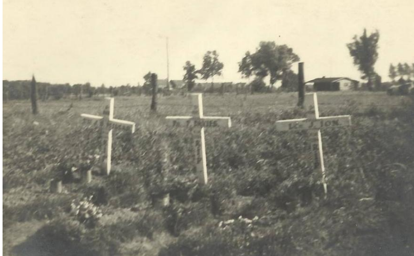
Tijdelijk graf in de Slegerstraat

Zoals in de vorige nieuwsbrief vermeld, wordt er in de Slegerstraat ter hoogte van de grote groene poort, rechts naast de hoofdingang van het kerkhof, een steen geplaatst met daarop de foto's van de drie militairen welke in september 1944 er een tijdelijk graf gehad hebben. Pas een jaar later werden de stoffelijke resten overgebracht naar het Brits Oorlogskerkhof in Mierlo.