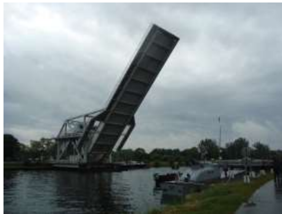
De nieuwe Pegasus brug in geopende toestand

Aan de brug staan meerdere monumenten, waaronder een borstbeeld van majoor John Howard.