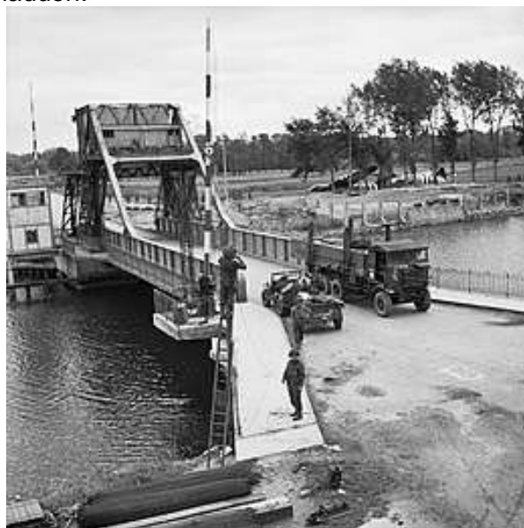
F I Strijdbewijs

De brug enkele dagen na de verovering; zie de Horsa zweefvliegtuigen onder de bomen.