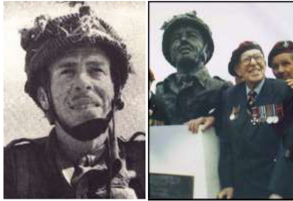
F I Strijdbewijs