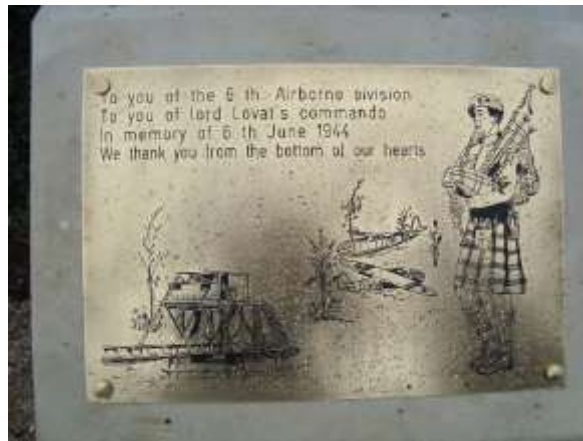
F | H.Raaijmakers

Ter ere van de Britse luchtlandingstroepen werd de brug over het kanaal van Caen vanaf zomer 1944 de Pegasusbrug genoemd. De Ornebrug werd omgedoopt tot Horsabrug.