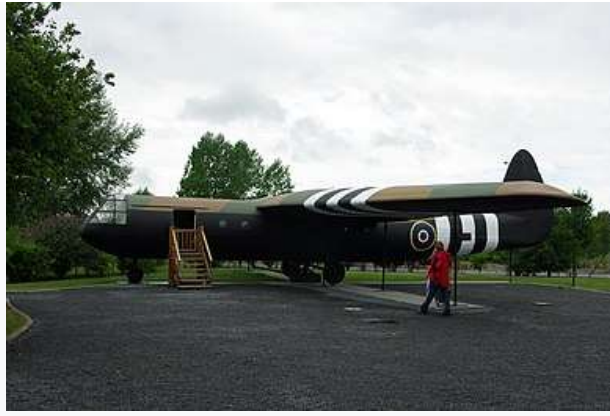
F | Wikipedia

De Airspeed Horsa Assault Glider was een zweefvliegtuig dat in de Tweede Wereldoorlog diverse keren grootschalig bij geallieerde luchtlandingsoperaties werd gebruikt. Het was ontwikkeld door de Britse firma Airspeed en genoemd naar de legendarische veroveraar Horsa. Tijdens operaties werden ze hoofdzakelijk ingezet ten behoeve van de Britse 1e en 6e Luchtlandingsdivisie.