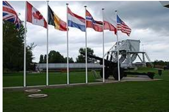
F | Wikipedia