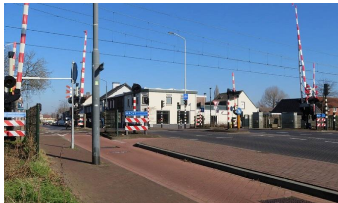
F| © M. Coolen Jr.