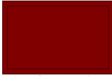
Insigne van het Canadese 5e Pantserdivisie

Na de doorbraak over de Rijn splitsten de legers van de geallieerden zich in drie groepen. Een van deze groepen, voornamelijk Canadezen, maakte een rondtrekkende beweging en begon de opmars voor de bevrijding van Nederland vanuit het oosten.