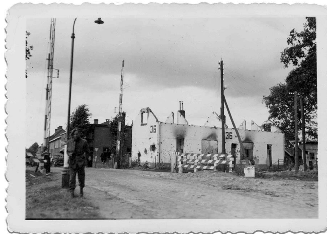
F| © M. Coolen. Sr