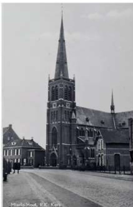
F I RHcE