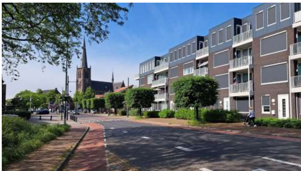
F I SHMMH

De Sint-Luciakerk is de parochiekerk van Mierlo-Hout in Helmond en is gewijd aan Lucia van Syracuse.